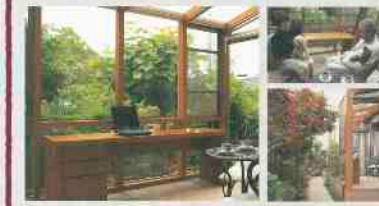
cocoma (ココマ) (ガーデンルームタイプ2間×8尺)

リビングの延長スペースとして「ココマ」を設置。「コンパクトで、我が家の庭にぴったりです。リビングと同じ明るいブラウンカラーがあったおかげで、母屋と一体感のあるおしゃれなラウンジ空間ができました」と、そのラウンジから四季を感じながら思うがままに愛犬と過ごす、悠々自適な暮らしが生まれています。