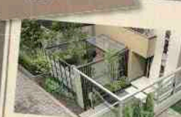
プラスG (G-ルーフ・テラスタイプ)

外観は本目調の形材で建物や植栽との調和を重視。また内観はネジ止め部分をカバー材で隠すなど細部にまで気を配りました。