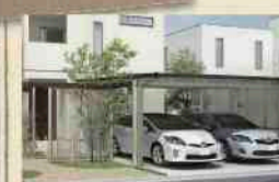
ソルディーボート