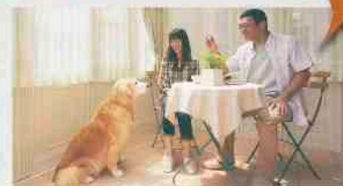
暖蘭物語 (基本タイプ2間×6尺)

愛犬のさくらは12歳。「今後のさくらの暮らしを考えてあげたい」と真剣に思われたご夫婦は、愛犬の負担が少ない細やかな工夫のできる「暖蘭物語」を選びました。夏の朝はひんやりしたタイルに寝そべり、冬は陽だまりでお昼寝するさくら。ご夫婦も天井に広がる青空や星空を楽しむ暮らしが生まれ、幸せの密度もいっそう増したと微笑まれました。