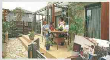
Zima (ジーマ) (ジーマ:2.0間×8尺+ ジーマテラス:1.5間×6尺)

子どもたちや愛犬が自由に遊べる空間が欲しい、と思ったのをきっかけに「ジーマ」を選びました。自然の恵みを満喫できる素敵な空間が誕生し、庭の一角には、バーベキューが楽しめるコンロやシンク、バーゴラの付いたベンチを設け、家族や友達が集えば、すぐにガーデンパーティーを開けるようになりました。